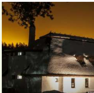
Хаты-мазанки — это сне же делают из г