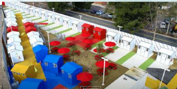
Дом-сыр и Версал Жилье, которого нет: Как архитектура решает проблемы бездомных