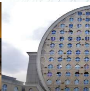
Дом-сыр и Версал Жилье, которого нет: Как архитектура решает комплексы, которые н