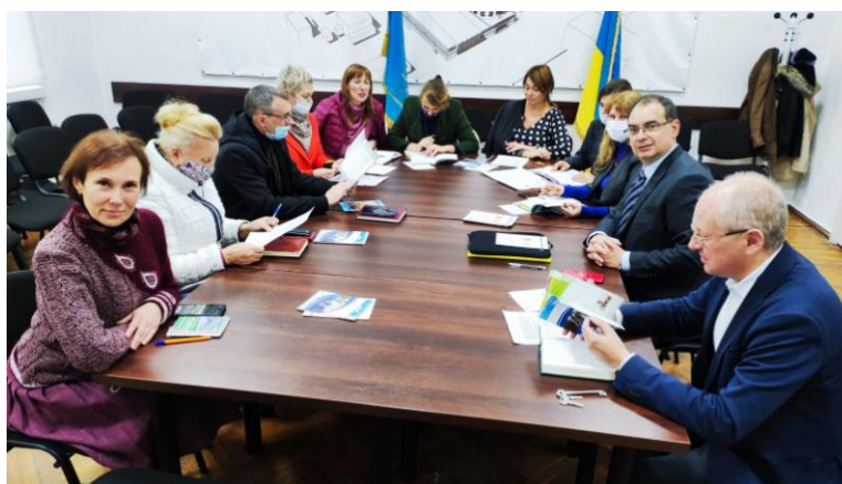
У ході зустрічі було отримано пояснення з основних питань

ESFAM також працює над майбутнім працевлаштуванням у франкомовних країнах для зміцнення зв'язку між академічним світом та професійним з метою інтеграції випускників