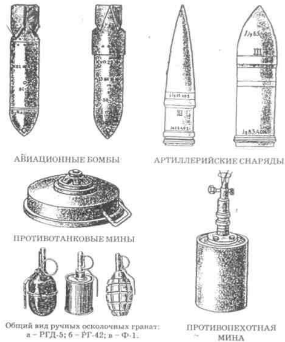
Рис. 2. Штатні вибухонебезпечні предмети

Саморобні ВВП (рис. 3) відрізняються величезною різноманітністю типів вибухової речовини і запобіжно-виконавчих механізмів, форми, ваги, радіусу ураження, порядку спрацьовування і т.д. і т.п. Їх особливістю є непередбачуваність прогнозування моменту і порядку спрацьовування вибухового пристрою, а також потужність вибуху.